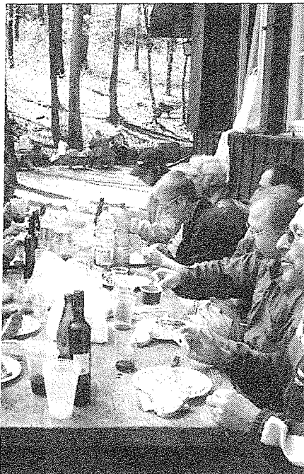
ist das Zvieri verdient.